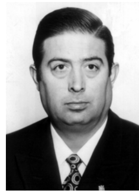
C. Nadal (ES)